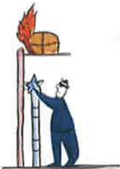
Contact direct ou rayonnement