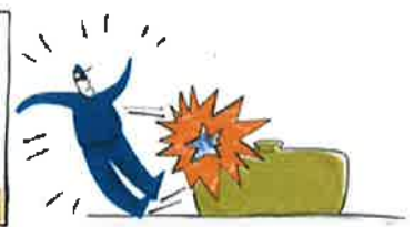
Explosion mauvais dégazage

Rappel des principaux modes de propagation de la chaleur