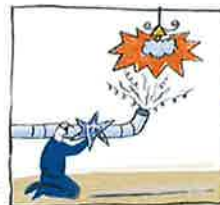
Transfert gaz chauds